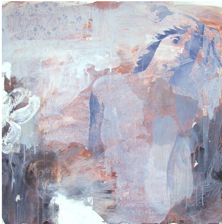
PEINTURE RÊVE 100x100cm

Nous sommes tous des créateurs, et nous créons avec nos pensées à chaque instant les couleurs du monde autour de nous.